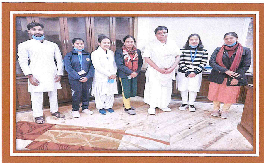
Post Graduate Students with Honourable Vice Chancellor, UOP