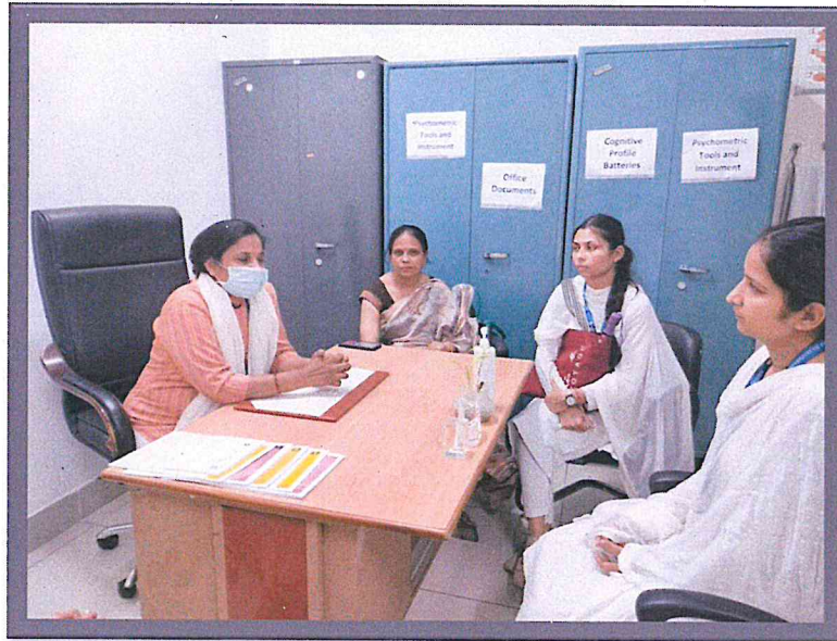
Interaction session between Clinical Expert and Students