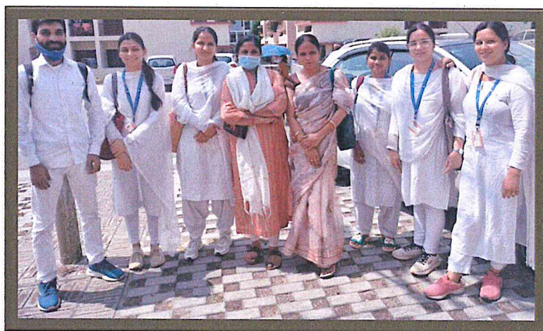
Post Graduate students with Field Expert and HoD, Psychology